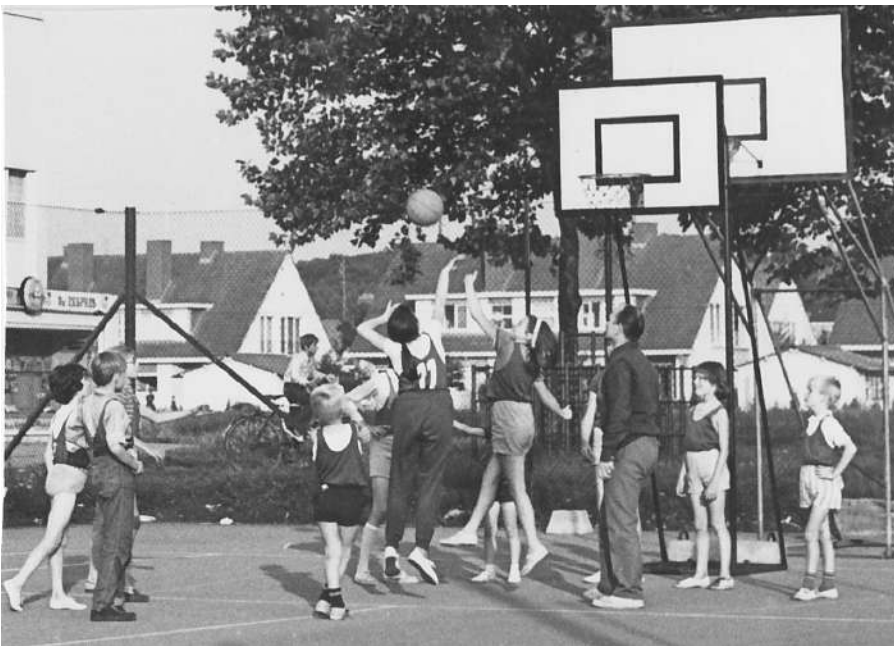
jeugd Jobaca 1970

In 1955 ben ik door mijn werk in Leuven beland. Ik had de keuze tussen twee clubs, Tempo en De Lo. Ik koos voor De Lo het dichtste bij. Ze speelde op een koer van de school in de wijk. Ze hadden en jaartje gepoogd met een vrouwenploeg maar het lukte niet. De mannen in 2de provinciale en de jeugd deden het beter. Ondertussen werd in Leuven het park De Bruul opgericht. Op vraag van de burgemeester zijn we naar daar verhuisd. We hebben het vier jaar volgehouden. Door gebrek aan centjes zijn we moeten stoppen. Na een half jaartje zonder basket, terug naar onze "heimat" Cassablanca onder de benaming "JoBaCa". We hadden een eigen clublokaal en kleedkamers in het nu nog bestaande wijklokaal. We organiseerden vele feestjes die geld in het laatje brachten. We betaalden zelfs spelers. Elk jaar de titel, van 2de provinciale naar 4de nationale. Zelfs 1 jaar een Amerikaan in onze ploeg. Maar door het stijgen moesten we in een zaal gaan spelen. De kas droogde op. Geen contact meer met lokaal.