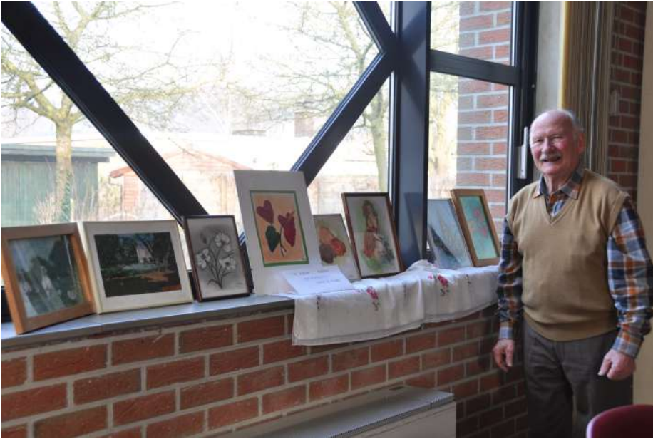
spaghettidag Blue Tigers, Genadedal, 2013

Op zeventig jaar tijd zijn de spelregels grondig gewijzigd. In het begin was het 3 seconden gebied maar 1 meter breed. Door de opkomst van grotere spelers heeft men de zone verder uitgebouwd. Nu zitten we al aan een breedte die langer is dan de vrijworplijn. Men had toen terreintjes van 24 meter, nu gemiddeld 30 meter. 3 Puntlijn bestond niet. Telkens opworp bij tussen-twee. Er is zelfs een periode geweest dat je vrijworpen mocht weigeren te nemen. Je mocht terug naar je eigen zone. Geen 24 sec. Vroeger 2 x 20 minuten, nu 4 kwarts. En dit houdt niet op. In Amerika zijn de kwarts 15 min.