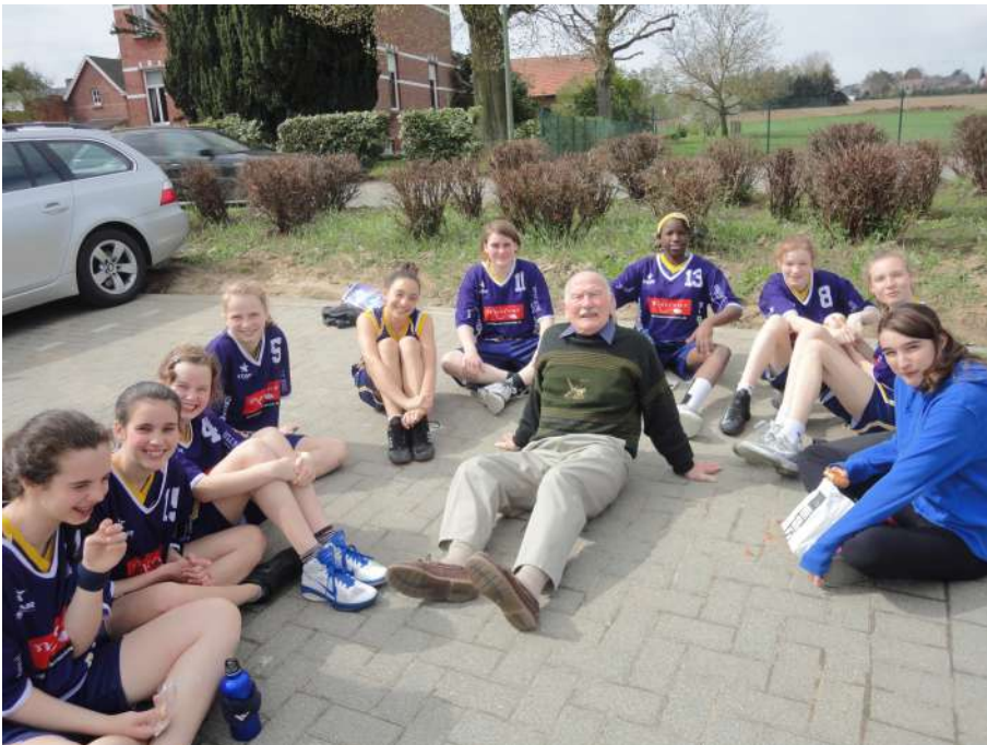
Pupillen Blue Tigers, toernooi Lubbeek 2013

Een gouden raad aan onze trainers: "geef haar een pluim en zij krijgt vleugels"