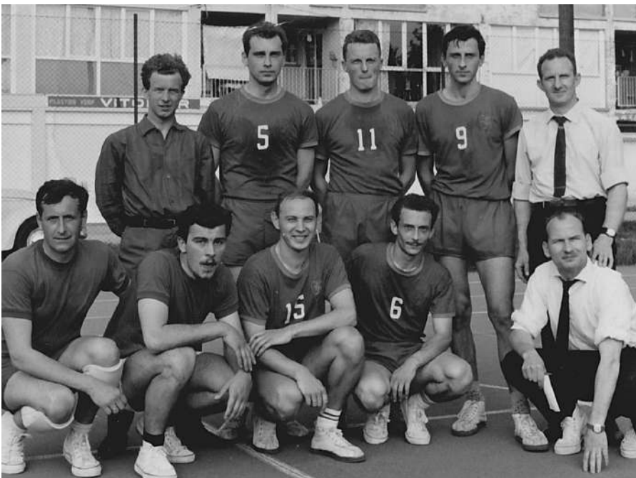
heren Jobaca 1962-1963

In 1951 hebben we in Machelen een club opgericht. Zelfde historie. Een asseterrein. Maar de lijnen met bakstenen op hun kant. In de grond gewerkt met hun kopje naar boven. De grond verzakte. Je moest niet alleen voorbij dribbelen maar ook over de stenen. De kleedkamer-barak diende ook voor café. Met een Leuvense stoof in het midden. Warm water voor je te wassen kwam uit een teil verwarmd door de stoof. Door de jaren heen heeft de club een ander terrein gekregen. Op de plaats waar nu de Makro staat. Vele jaren later kon de ploeg over een ander terrein beschikken. Het gebouw was het eerste wasmachinebedrijf in België. Ze produceerden een houten vat met binnen in een ronddraaiende driepikkel, buitenaan een motor. Door de opkomst van moderne machines stopte de firma. En Machelen's basket had haar eigen zaal. De club bestaat nog steeds maar speelt nu in een echte sportzaal.