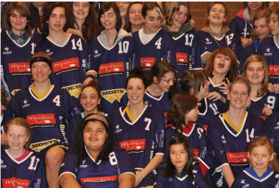
jeugdvoorstelling Blue Tigers 2012

Mijn eerste meisjes team kwam er in 1951. Enkele vriendinnen hadden de mannen zien spelen. Ze wouden het ook eens proberen. Al vlug hadden ze een ploegje gevormd. Hun eerste wedstrijd kwam eraan. Onze meisjes moesten zich thuis omkleden. De bezoeksters bij mij thuis.