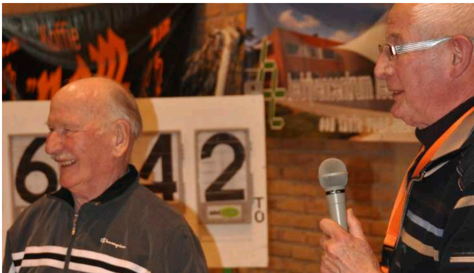
paastornooi Blue Tigers 2013